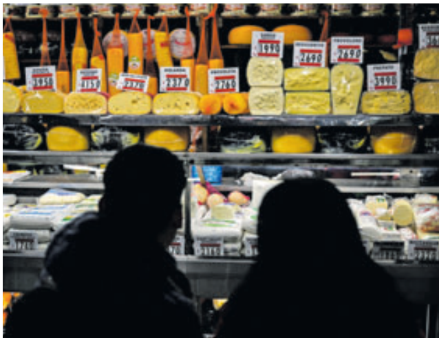
La mayor retracción anual se dio en alimentos y bebidas (-8 %) y el mayor incremento se pudo ver en calzado y marroquinería (6,6 %, productos como bolsos, guantes, etc.).

Otras mediciones oficiales y privadas también han dado cuenta de una retracción del consumo en Argentina en lo que va de este año, en un contexto de alta inflación (138.3 % en septiembre, según los datos oficiales disponibles) y de pérdida del poder de compra de los ingresos.