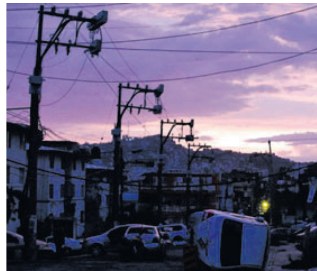
En las labores de reparación hay 2,900 trabajadores electricistas, 283 grúas, 875 vehículos y siete helicópteros.