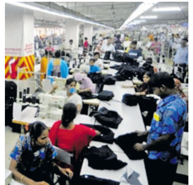
Los trabajadores exigen casi triplicar el salario mínimo mensual, de 74 dólares a 205 dólares.